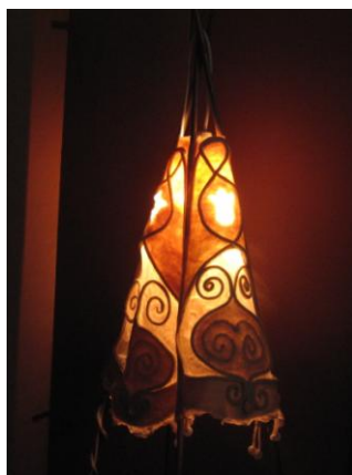
Bartha Csilla nemezelt lámpa voállal kombinálva