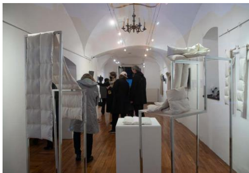
A kiállítás előtérben az Argentex ágyneműcsalád

Lévai Zsófia fashion-tech dizájnra a kifejlesztett öltöztékekben az emberi kommunikáció nonverbális gesztusait szenzorok segítségével dolgozza fel és azokat jelekké transzformálva jeleníti meg a textilanyagban. A ruhadarabok a közösségi médiából származó, előre feldolgozott adatokat tárolnak, az ugyanahhoz a hálózathoz csatlakozva, kicserélik ezeket az adatokat, és egy algoritmus felfedi a felhasználók közötti közös vonásokat.